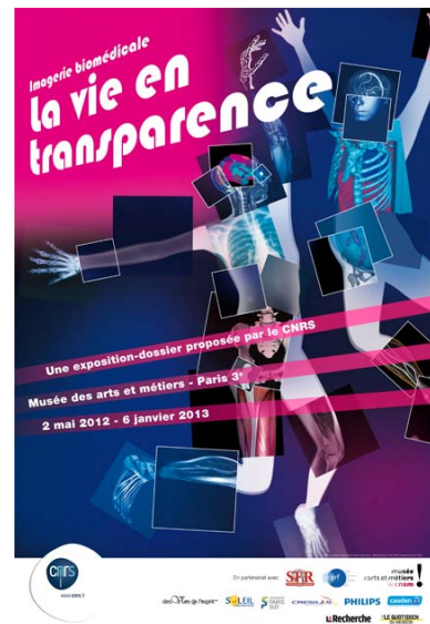
Affiche de l'exposition « Imagerie biomédicale, la vie en transparence », du 2 mai 2012 au 6 janvier 2013.