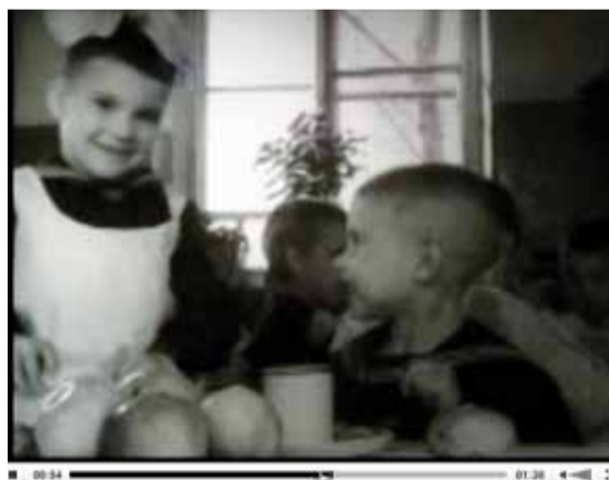
Un orphelinat soviétique à Irkoutsk