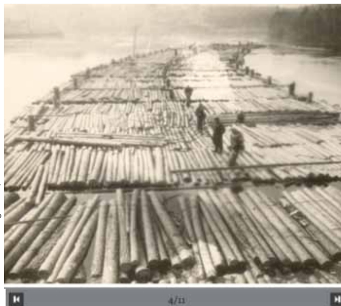
Flottage du bois dans le fleuve Ienisseï à Igarka

Ses formes étranges fascinent les déportés, sa présence est presque rassurante dans l'environnement brutal du travail et du froid. La forêt et ses habitants inspirent les déportés. Valli Arrak a dessiné plusieurs « émotions sibériennes » durant son exil, illustrant l'environnement sibérien. Avec la démocratisation de la pratique photographique en URSS, de très nombreuses photos prises par les déportés témoignent des sensations intenses suscitées par l'immersion en forêt. ■