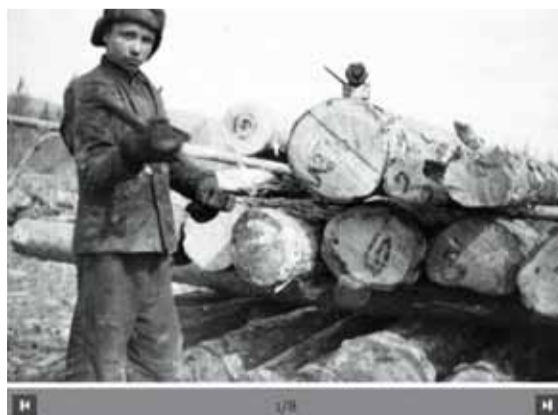
Enfant affecté aux travaux forestiers