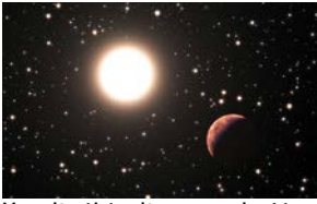
Vue d'artiste d'une exoplanète orbitant autour d'une étoile jumelle du Soleil dans l'amas Messier 67.

- Sous embargo jusqu'au mercredi 15 janvier 2014, 12h -