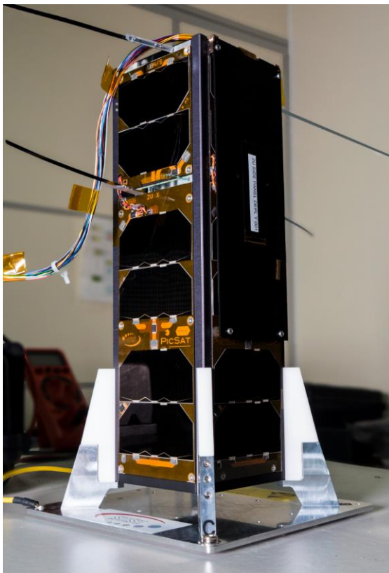
PicSat, avec ses antennes déployées, dans la salle blanche du laboratoire