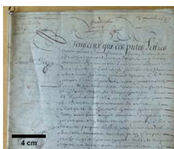
Parchemin du 17 e siècle

Une cartographie de l'état de dégradation de parchemins historiques vient d'être réalisée pour la première fois grâce à une technique de microscopie optique, précédemment optimisée pour l'imagerie du collagène dans les tissus biologiques. Ce travail a été effectué par des physiciens et chimistes de l'Université Paris-Sud, du CNRS, du Ministère de la culture et de la communication, de l'École polytechnique et de l'Université Pierre et Marie Curie. L'invasivité minimale et la rapidité de cette méthode permettent d'envisager le diagnostic sans contact ni prélèvement de grandes collections ainsi que le suivi régulier d'œuvres fragiles. Ces résultats obtenus sur des parchemins historiques dans le cadre d'une collaboration pluridisciplinaire sont publiés dans la revue Scientific Reports du 19 mai 2016.