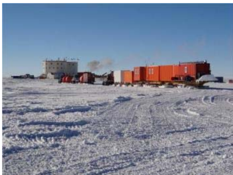
Arrivée du convoi scientifique à Concordia le 16 décembre à 19h, en provenance de Cap Prud'homme.