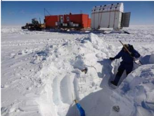
Revisite du puits de 3,5 m de profondeur le 10 janvier à S2, pour la stratigraphie.

Pendant ce temps, à S1bis, réalisation d'un puits de 1 m pour stratigraphie au niveau d'une transition entre un dos de baleine et une zone d'accumulation. Photos infrarouges et prélèvement de la tranche de neige de 10 cm d'épaisseur par 1m de hauteur.