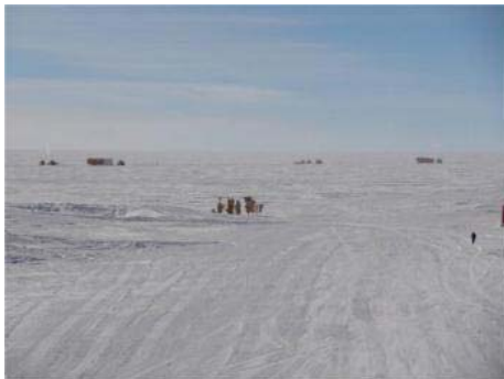
Départ du convoi scientifique de Concordia le 20 décembre à 8h30, prenant la direction du sud. On distingue au premier plan les pancartes kilométriques reliant Concordia au reste du monde.

Ce mercredi 21 décembre, le convoi ne progresse pas et reste sur le point situé à 10 km de S0 (70 km au sud de Concordia) pour conduire pendant une journée un programme scientifique dense, comprenant notamment la réalisation de puits profonds pour échantillonner la neige des dernières décennies, en vue de nombreuses analyses glacio-chimiques en laboratoire au retour des échantillons en France.