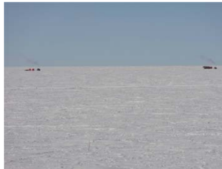
Deux des quatre attelages du convoi scientifique photographié en zoom depuis le 3ème étage de la base Concordia. Ils se situent alors à une quinzaine de kilomètres de la base après deux heures de roulage.