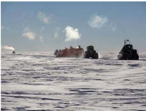
Arrivée d'une partie du raid à S1bis le 11 janvier. Le premier tracteur, arrivé le premier à S1bis, est reparti pour aider le deuxième tracteur qui tirait une lourde charge et allait moins vite. On voit l'élingue liant les deux tracteurs. Derrière, on distingue le Kassbohrer Pisten Bully qui nivelle la trace en vue de passages ultérieurs dans les années à venir.