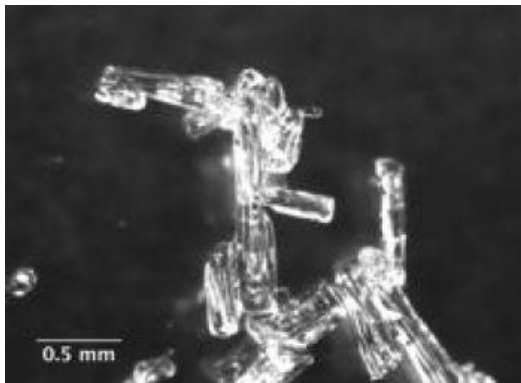
Photo de Diamond dust réalisée par Martin Schneebeli, SLF/Davos, Suisse. L'air est très sec en Antarctique car très froid. Il se forme, même quand le ciel est clair, des « Poussières de diamant » qui sont de fins cristaux de glace qui constituent une part importante de la précipitation neigeuse. Ces cristaux scintillent dans l'atmosphère et sont quelquefois la cause de magnifiques phénomènes optiques.

A S1bis : approfondissement du puits jusqu'à 4 m. Stratigraphie photographiée en infrarouge. Prélèvements d'échantillons pour la physique de la neige. Installation dans la caravane "science" en prévision du carottage Explore et calibration de l'instrument LiCor pour l'analyse continue du \text{CO}_2 dans l'air du névé à S0.